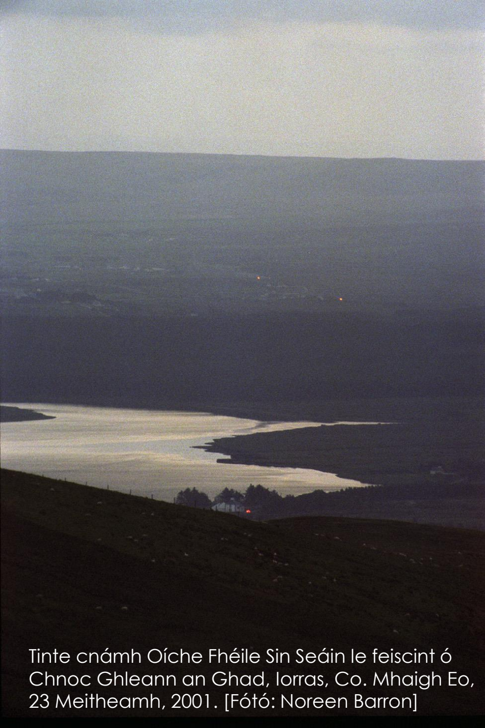
Tinte cnámh Oíche Fhéile Sin Seáin le feiscint ó Chnoc Ghleann an Ghad, Iorras, Co. Mhaigh Eo, 23 Meitheamh, 2001.