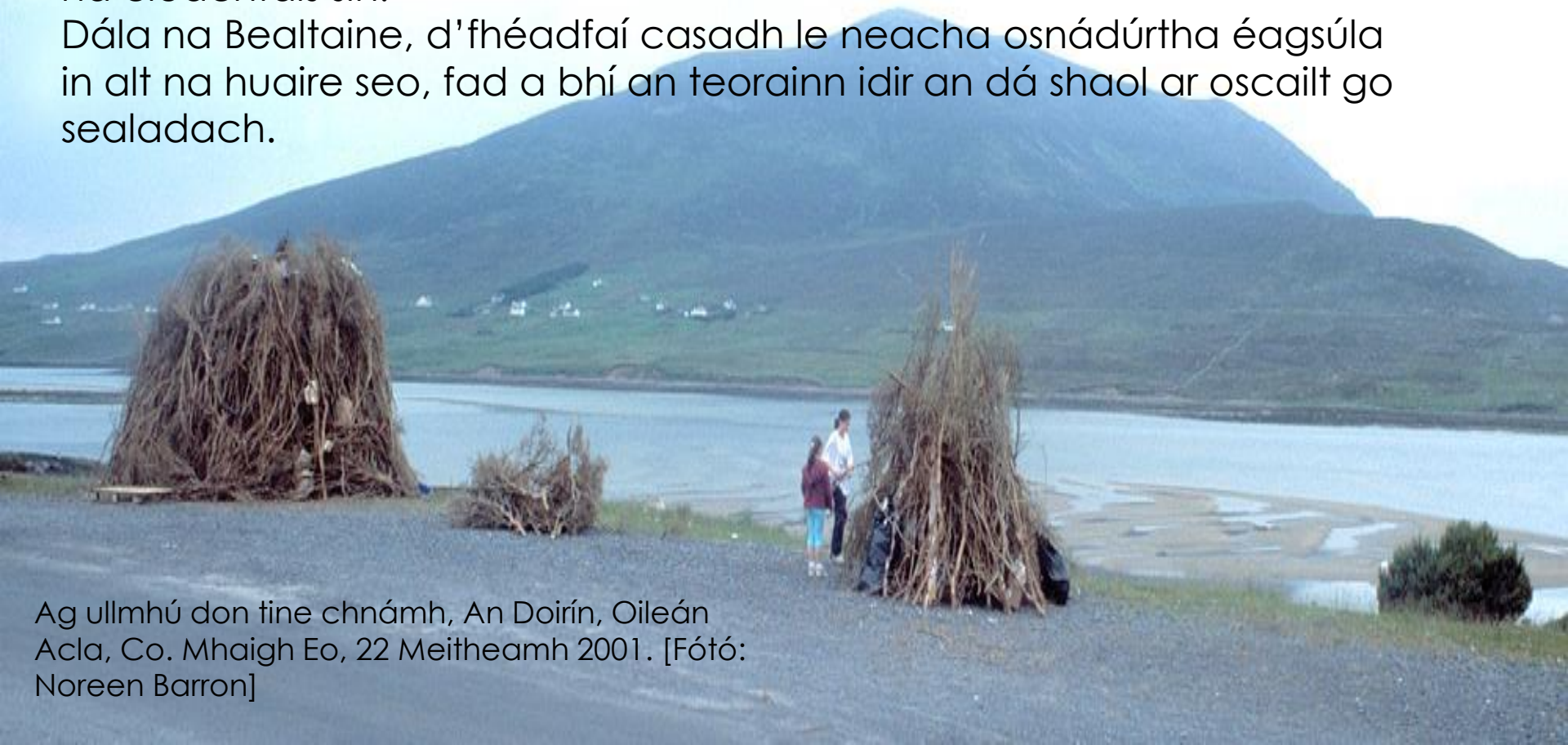
Ag ullmhú don tine chnámh, An Doirín, Oileán Acla, Co. Mhaigh Eo, 22 Meitheamh 2001.

Dála na Bealtaine, d'fhéadfaí casadh le neacha osnádúrtha éagsúla in alt na huaire seo, fad a bhí an teorainn idir an dá shaol ar oscailt go sealadach.