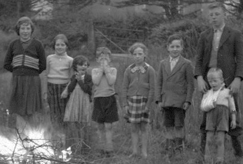
'Tinteán Sin Seáin', Oíche Fhéile Sin Seáin, Áth an tSléibhe, Co. Luimnigh, 23 Meitheamh 1960.

Teaghlaigh aonair a lasadh tinte cnámh go príomha, ach bhí tóir freisin ar thinte cnámh ag leibhéal an phobail. Ócáid thábhachtach ba ea an tine chnámh chomhchoiteann don fhéastaíocht agus don spórt, agus mar uair fhabhrach ag lucht suirí tabhairt faoin bhfáistineacht.